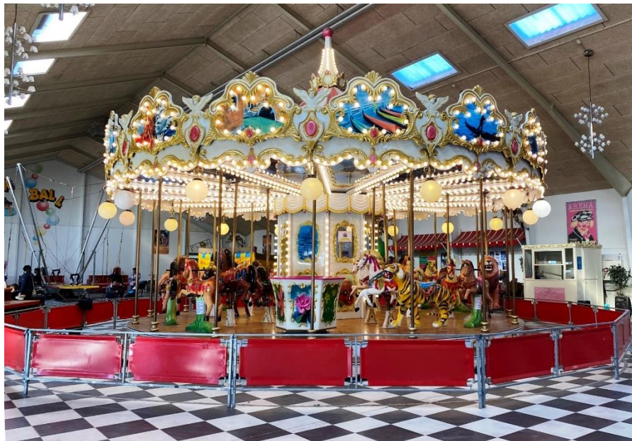
Stemmingsbillede fra Cirkusland