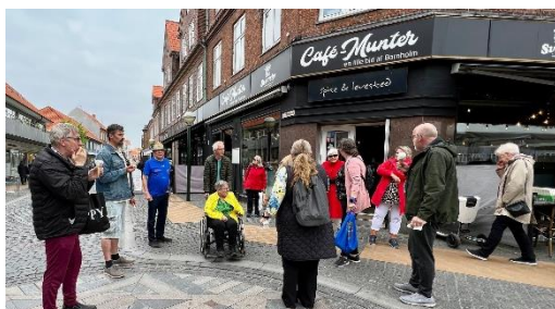
Frokost i Rønne inden hjemturen