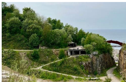
Granitbruddet i Vang

Ved Boderne Havn heppede vi på de medlemmer, som gik Bornholm Rundt