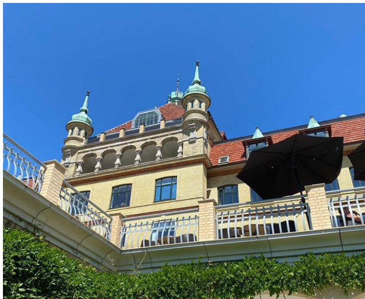
Stemmingsbillede fra Hotel Vejle fjord i juni